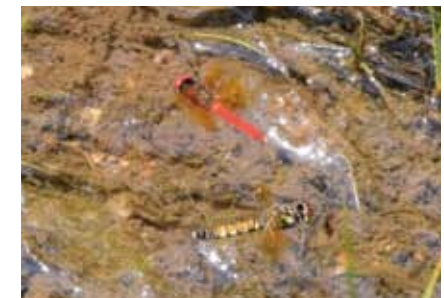
産卵 (オスはホバリング)